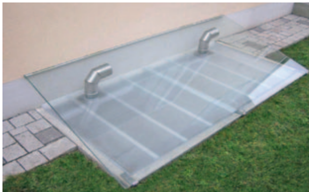
Lüftungsrohre unter Schutzabdeckung