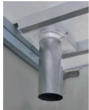
Lüftungsrohr wasserhemmend durch Acryl-Abdeckung geführt