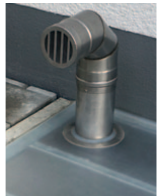
Lüftungsrohr rund mit Schutzklappe