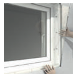
4. Einsetzen der Vorsatzscheibe