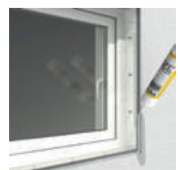
5. Abdichten mit Hain-Dichtmittel