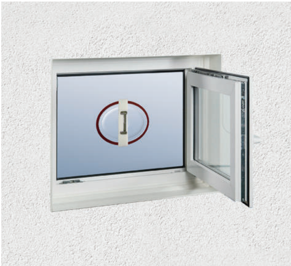
Das Ergebnis: Ein hochwasserdichtes Kellerfenster durch außen vorgebaute Acryl-Vorsatzscheibe mit Belüftungsmöglichkeit

Sich verändernde Klimaverhältnisse und neu gestiegene Grundwasserspiegel erfordern massive Sicherheitsmaßnahmen gegen Überflutungs- und Hochwasser-Einflüsse.