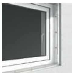
2. Anbringen der Abstandhalter