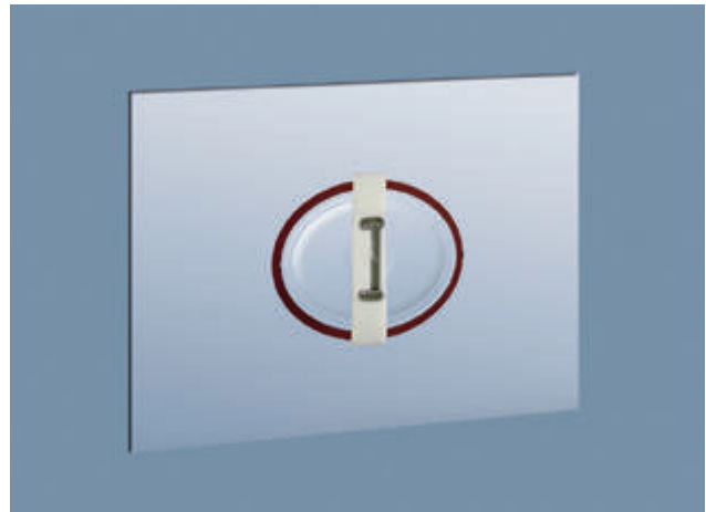
Optionale Belüftungsluke, manuell zu öffnen, mit Drehgriff zu arretieren.