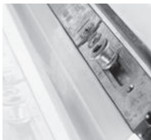
Bewegliche Teile werden eingestellt, gesäubert, gefettet und auf ihre Funktion getestet.