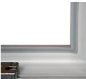
Verstärkte Dichtung gegen evtl. Wasserdruck.