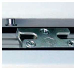
Justierung und optimale Einstellung der Beschläge, vorbereitet zur Druckaufnahme.

Verbindliche Leistungsbeschreibung siehe Vertragsbedingungen.