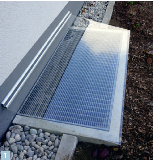
Abb links (1)

Schmutz-, Regen- und Einbruchschutz nach Maß – und dazu noch gut anzusehen