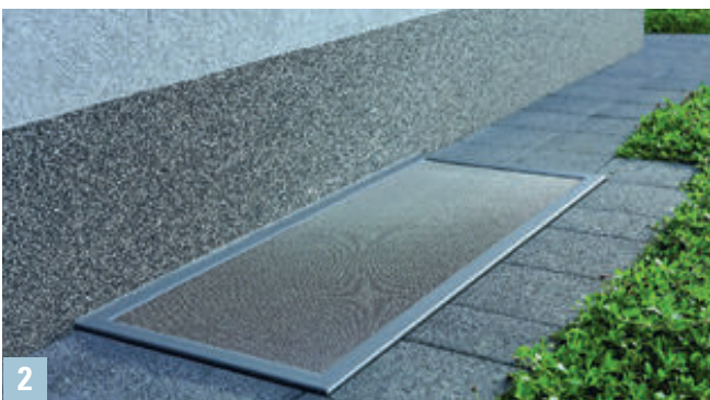
Abb links unten (2)