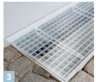
Abb oben (3)