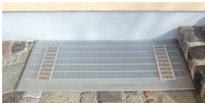
Zeitgemäße Ästhetik, das moderne Design passt zu bestehenden Häusern und Neubau.

Bei erhöhtem Lüftungsbedarf zusätzliches Gitter oder Hain Abdeckung mit Lüftungssteuerung (siehe Aquanaut, Seite 51) wählen.