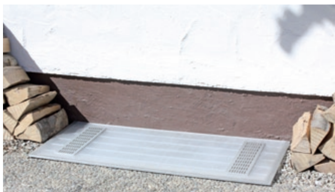
Flache Auflage, begehbar, viele Größen möglich. Einfach auf Gitterrost auflegen und mit Schrauben fixieren.