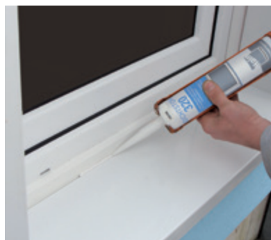
Die Verriegelung zur Stoßkante muss abgedichtet werden.