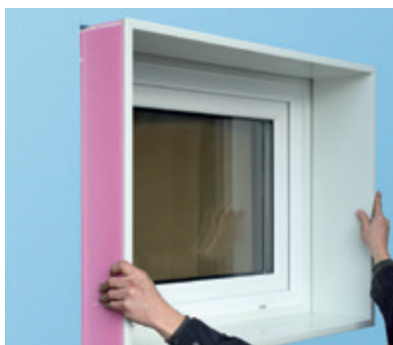
Der Steckrahmen wird maßgenau nach Kundenvorgabe geliefert.