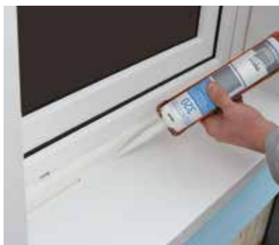
Die Verriegelung zur Stoßkante muss abgedichtet werden.