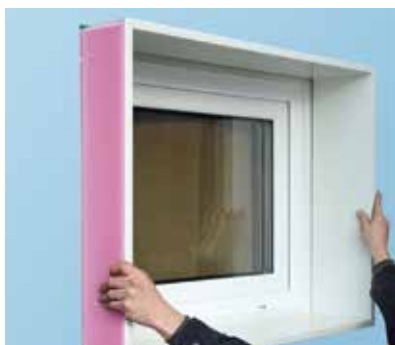
Der Steckrahmen wird maßgenau nach Kundenvorgabe geliefert.