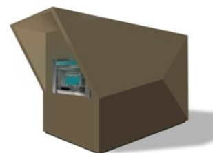
Der Hain Q-SB Schalter gegen kriminelle Geldautomatensprenger und Vandalismus